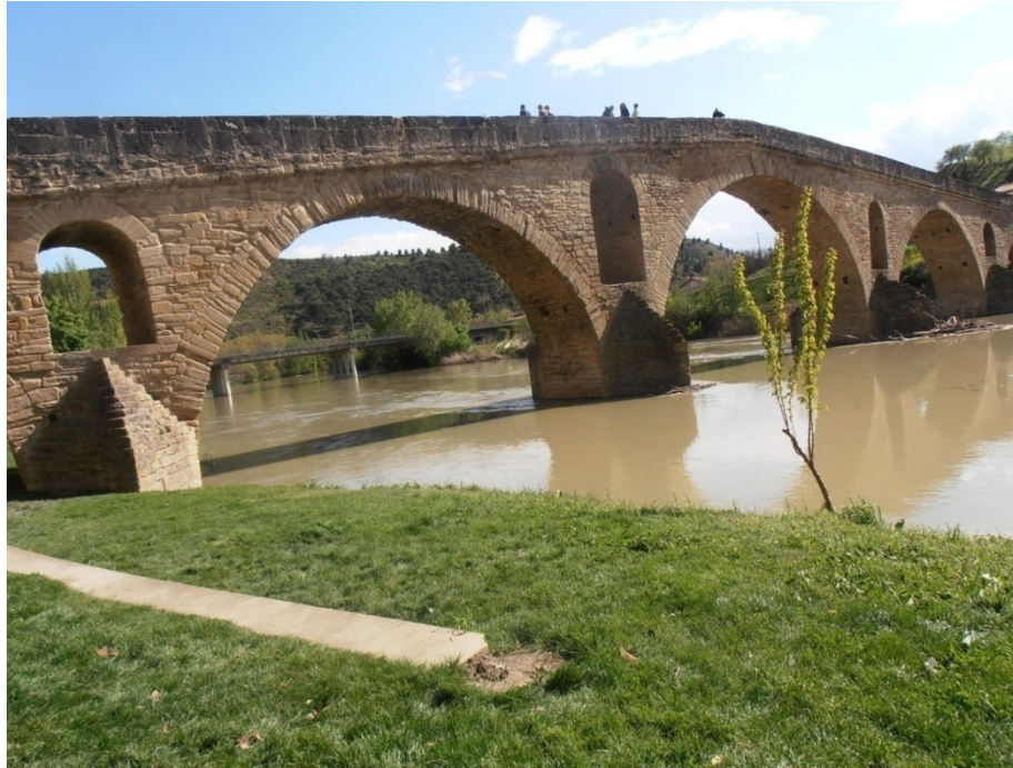
segnando la tappa, Puente de la Reina.